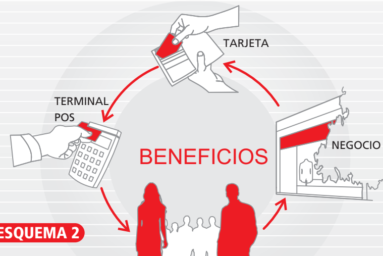
• ESQUEMA 2